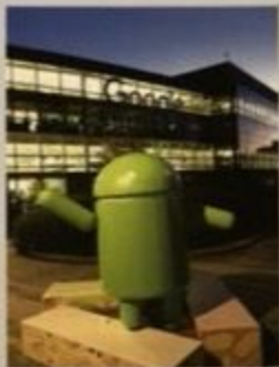
位于硅谷的谷歌总部

1929年，哈米特的代表作《马耳他之鹰》在《黑面具》杂志上开始了连载。故事的主角是旧金山私人侦探山姆·斯佩德。他因为一个委托人的寻人请求，卷入了寻找无价之宝“马耳他之鹰”雕像的冒险。小说中很多地方都是在旧金山真实存在的，就连斯佩德住所的原型也是作者自己的住处。虽然哈米特在书信中提到过他的住址是在博斯特街（Post Street）891号，但并没有说是在哪个屋子。不过人们还是可以根据《马耳他之鹰》中提到的蛛丝马迹判断出斯佩德住在401房间。依据包括斯佩德提到过关于所在寓所的楼层，距离电梯的远近，以及公寓内部的结构。斯佩德的侦探事务所身处当时旧金山第四高的摩天大厦里。旧金山有两座跨海大桥，人们经常误认为在《马