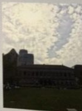
波士顿公共图书馆

所有模式，比如《玛丽·罗热疑案》中的安乐椅侦探，《金甲虫》中的密码破译，此外《你就是杀人凶手》和《失窃的信》也都堪称佳作。爱伦·坡的侦探小说每一篇都有着非凡的创新，柯南·道尔说，侦探小说家前行的道路上总能看到爱伦·坡的脚印。萧伯纳认为美国文学史上有两位巨擘，一位是爱伦·坡，另一位是马克·吐温。日本推理小说的鼻祖所用笔名“江戸川乱