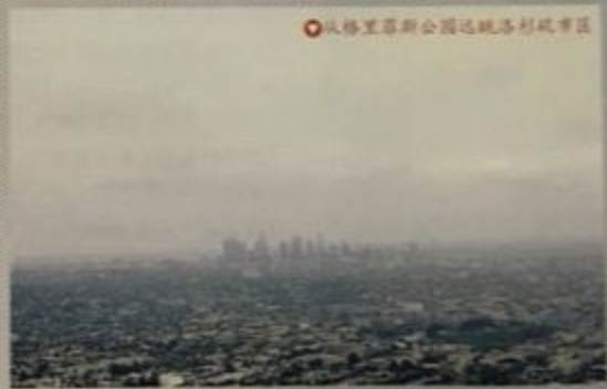
从格里芬斯公园远眺洛杉矶市区

从北加州沿着西海岸开车五个多小时，就可以到达洛杉矶。和达希尔·哈米特一脉相承的侦探小说作家雷蒙德·钱德勒曾经在这座“天使之城”居住过。1888年，钱德勒出生在芝加哥，后来他跟随父母搬到了英国，并于1913年来到洛杉矶定居。1933年，他的第一篇侦探小说《勒索者不开枪》