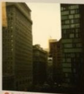
在旧金山市区，高楼鳞次栉比

1921年，达希尔·哈米特来到旧金山成婚，并在这里生活了八年，期间完成了大部分侦探小说的创作。他习惯基于自己熟知的人来塑造人物形象，也经常在小说中使用旧金山的街道名称。旧金山也一直铭记着这位作家，这里有一条