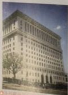
洛杉矶地检处调查员办公室所在地 （图例：Ken Lund）

和哈米特一样，钱德勒作品中的地名大多数都是真实存在的，比如“海湾市”指代的是洛杉矶沿海城市“圣莫尼卡”，毗邻著名公立研究型大学加州大学洛杉矶分校。《长眠不醒》中地名的真实度颇高，足以让人根据描述还原马