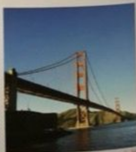
旧金山地标金门大桥