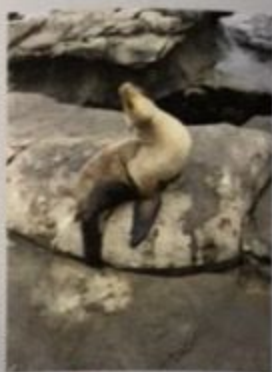
拉霍亚海边悠闲的海豹

在拉霍亚，钱德勒创作了《漫长的告别》和《重播》。《重播》中拉霍亚化名为“埃斯梅拉达”（Esmeralda）。可惜这部小说的质量差强人意，成为了唯一没有被改编成电影的作品。钱德勒对拉霍亚既厌恶又喜爱，他曾在信中说