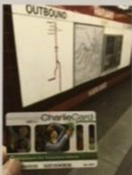
波士顿地铁的查理卡

养。不过他长大后来过波士顿很多次。1845年爱伦·坡的诗《乌鸦》发表后没多久，一名哈佛的教授曾邀请他回波士顿朗诵。这次朗诵活动很不成功，因为爱伦·坡并未按照事先约定的那样诵读《乌鸦》，而是读了他年轻时所写的另外一部作品，引起了听众的强烈不满。