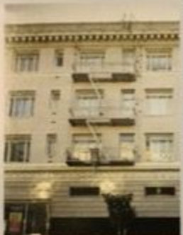
哈米特居住过的博斯特街 (Post Street) 891号

街道就叫“达希尔·哈米特街”。侦探小说学者多恩·埃龙提供了一条游览旧金山的路线，沿途景点都和达希尔·哈米特有关。